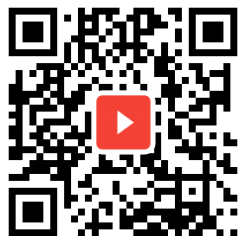
お口の笑トレ動画