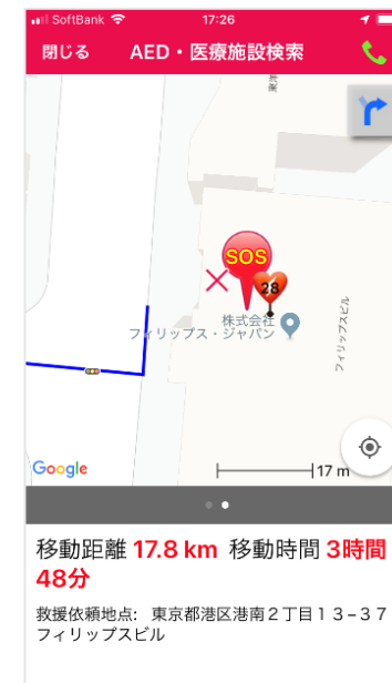
SOS発報場所 の地図確認