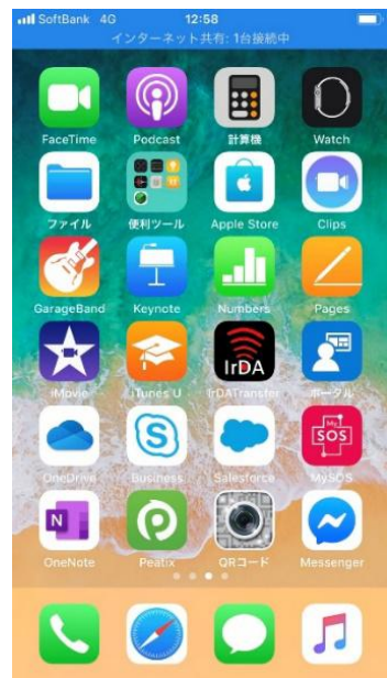
通常時 待ち受け画面